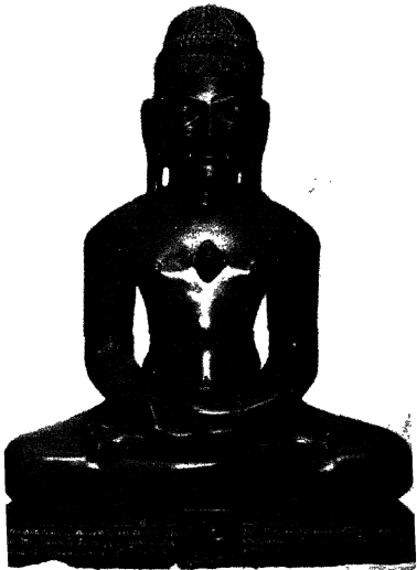
१०००८ भगवान श्री आदि नाथ जी